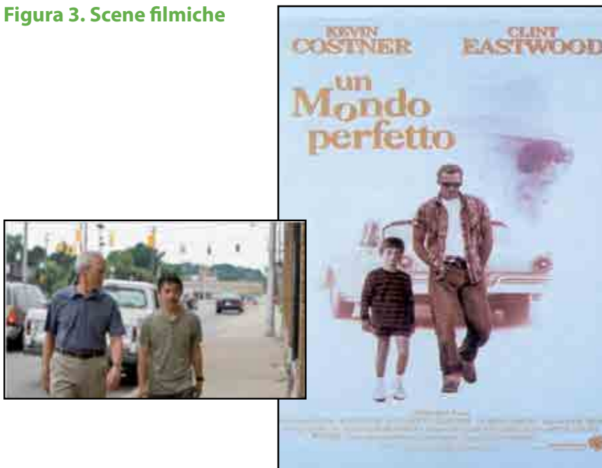
Figura 3. Scene filmiche