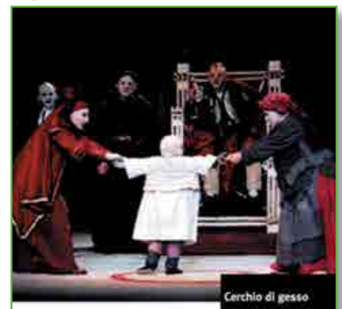
Figura 1. Scena teatrale

"Il cerchio di gesso del Caucaso" è un'opera teatrale di B. Brecht del 1944-45, trasposizione di un'antica leggenda orientale incentrata sull'amore genitoriale e sulla saggezza e sagacia del verdetto di un giudice, chiamato a riconoscere la vera madre di un figlio conteso (Figura 1). Il riferimento artistico-letterario ben si presta a introdurre la problematica sottesa alla cosiddetta "Sindrome di Alienazione Parentale" o PAS, codificata nel 1985 da R. Gardner, psichiatra forense alla Columbia University , e da allora più croce che delizia di famiglie, tribunali, psicologi e società civile.