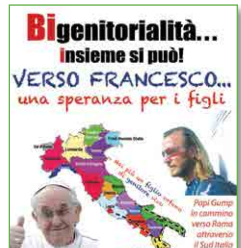
Figura 4. Papi-gump in cammino

nizzazioni sovranazionali (UNICEF, UNESCO, Banca Mondiale, Save the Children ), soggetti istituzionali (Garante dell'Infanzia, Osservatorio dell'Infanzia e Adolescenza), associazioni di volontariato paragonate o non governative più o meno note, come Caritas, Colibrì, Telefono Azzurro, Telefono Arcobaleno e - "last but not least" - Papi-gump, recentemente scesa in campo per la tutela appassionata della bi-genitorialità e dei diritti dei padri ex-coniugi, passati attraverso l'esperienza devastante vissuta tra alienazione, tribunali ed esiti processuali e oggi "più grigi ma non domi", come canta (il poeta) Claudio Baglioni, in difesa di principi e diritti comuni (Figura 4). Tale finalità può anche assumere, ben al di là delle vicende personali e generali di rifrazione paterna di "vulnus" alienatorio, una valenza di ricerca simbolica e di recupero di quelle radici psicologiche, antropologiche e culturali in grado di ricondensare e riempire di senso quella figura di padre la cui idea, secondo la formulazione di J. Lacan, si è come evaporata col venir meno della funzione orientativa dell'Ideale nella vita individuale e collettiva dell'ultimo secolo, mentre secondo altri (e molto più prosaicamente) è stata appannata e snaturata dal proliferare incontrollato di separazioni e divorzi, generando comunque quella che le scienze sociali definiscono una "società senza padri".